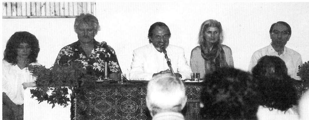
Gli oratori di varie nazioni che hanno preso la parola al «Centro dell'uomo» di Berceto durante l'ultimo convegno.

Essa infatti coinvolge personalità, spesso di spicco, di molti paesi e culture, portandoli a vivere insieme, a sedere alla stessa tavola ed a confrontarsi in un ambiente favorevole di elevata cultura e d'intensa