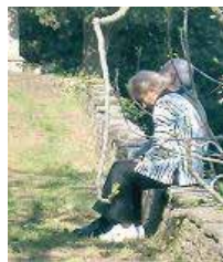
Pace a Sargiano