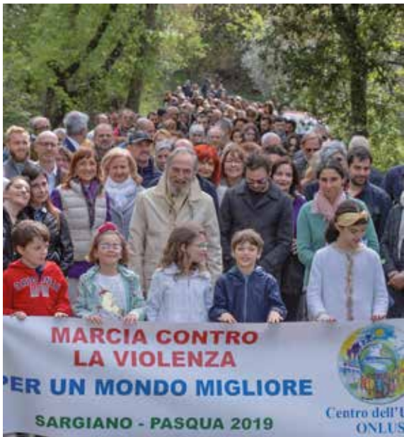
LA MARCIA Una delle tante iniziative che vengono prese ogni anno dal Centro dell'Uomo di Sargiano

tanissimo nel tempo ma assai vicino ai membri del Centro che attuano il motto del Santo «Ora et labora» con «Meditazione e servizio». Della meditazione abbiamo già detto, quanto al servizio è quello realizzato mediante progetti umanitari sia in Italia che nei paesi in via di sviluppo, come «100