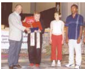
2002: Fernanda Pivano riceve il premio "Arte, Scienza e Pace"

Il Premio è assegnato periodicamente dal "Centro dell'Uomo" a una Personalità che si sia distinta nel campo delle arti e delle scienze per il suo messaggio di pace