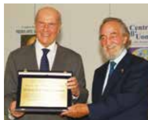
2012: consegna del premio "Arte, Scienza e Pace" al prof. Umberto Veronesi