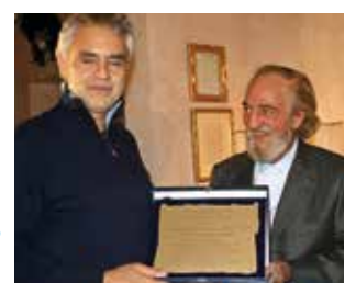
2015: Andrea Bocelli riceve dal Presidente il premio "Arte, Scienza e Pace"