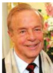
2005: il premio "Arte, Scienza e Pace" è assegnato al regista Franco Zeffirelli